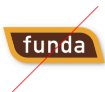
Geen slagschaduw gebruiken

De makelaar zal het beeldmerk van funda niet geheel of gedeeltelijk bewerken, vervormen, imiteren, reproduceren, aanpassen, wijzigen of op andere wijze aantasten en/of gebruiken in strijd met deze Richtlijnen voor het gebruik van het beeldmerk van funda. Dit mag bijvoorbeeld niet: