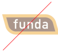
Niet in tinten of half transparant