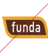
Niet disproportioneel schalen