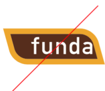
Elementen in het logo niet verschuiven